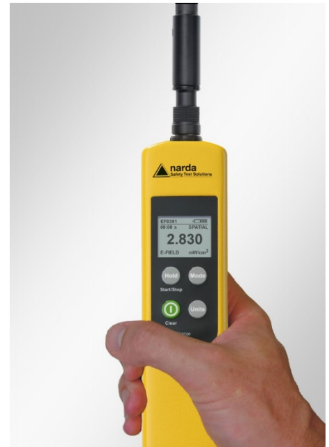
Klein, leicht und extrem robust – für den rauen Feldeinsatz besonders gut geeignet.