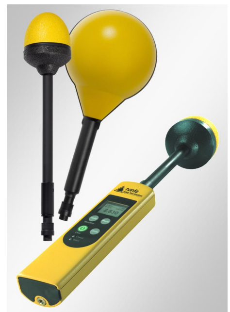
Schnell wechselbare Messsonden – ohne das Messgerät konfigurieren zu müssen.