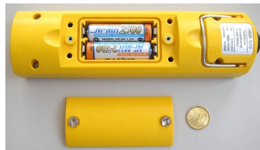
Das Batteriefach lässt sich einfach mit einer Münze öffnen. Das Gerät wird von zwei austauschbaren NiMH-Akkus Typ "AA" versorgt.