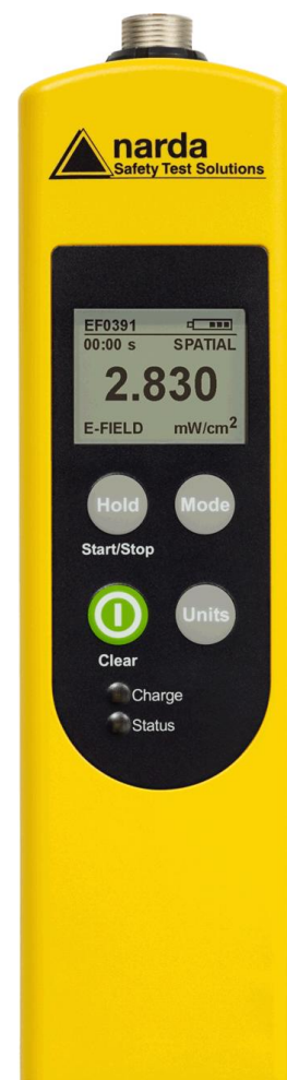
Narda Broadband Field Meter NBM-520