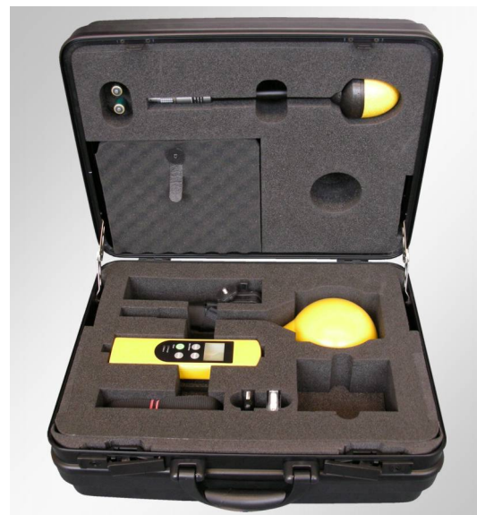
Ein stabiler Transportkoffer ist im Lieferumfang enthalten. Er bietet optimalen Schutz für das Messgerät, für bis zu zwei optionale Sonden sowie für das gesamte Zubehör.