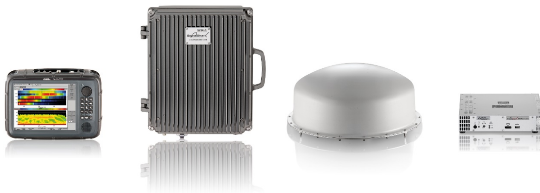
Narda SignalShark Familie in den Ausführungen (v. l. n. r.):

Kein Installationsort entspricht dem anderen, von daher kann ein allgemeiner Montagehinweis nur empfehlenden Charakter haben und Hinweise geben. Die tatsächliche Ausführung der Installation am Einsatzort bedarf deshalb einer präzisen Planung und Ausführung um optimale Peilergebnisse zu erhalten.