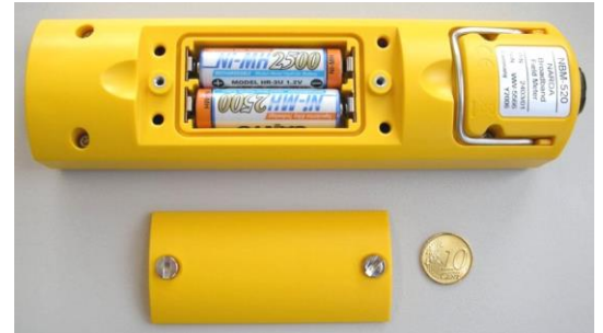
Das Batteriefach lässt sich einfach mit einer Münze öffnen. Das Gerät wird von zwei austauschbaren NiMH-Akkus Typ "AA" versorgt.