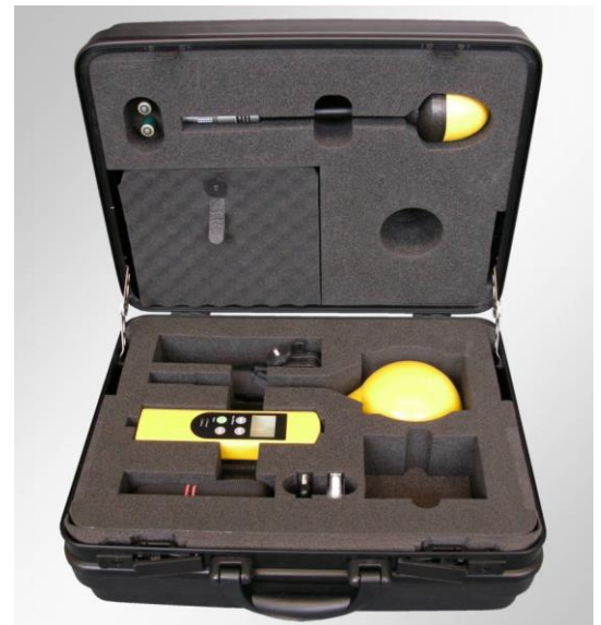
Ein stabiler Transportkoffer ist im Lieferumfang enthalten. Er bietet optimalen Schutz für das Messgerät, für bis zu zwei optionale Sonden sowie für das gesamte Zubehör.