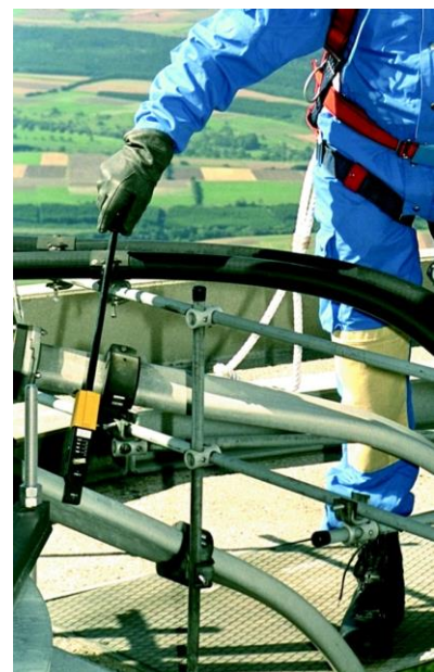
Leckstellensuche mit RadMan XT