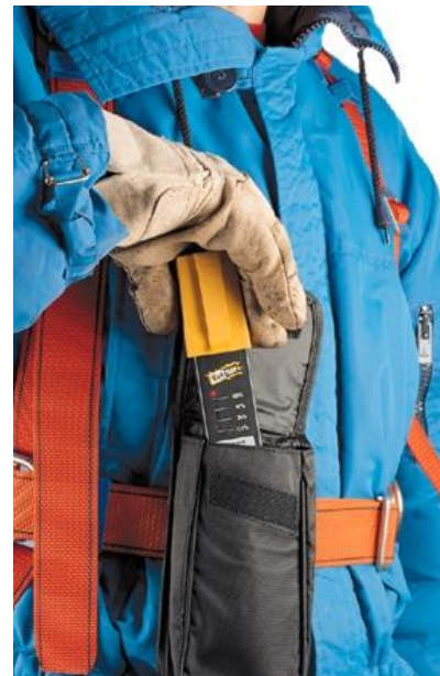
RadMan XT als persönlicher Strahlungsmonitor für HF-Signale

Alle RadMan Strahlungsmonitore eignen sich zum Aufspüren von Leckstellen an Hohlleitern und Koax-Schraubverbindungen (Bild rechts). Ein nichtleitender Verlängerungsgriff ist als optionales Zubehör erhältlich.