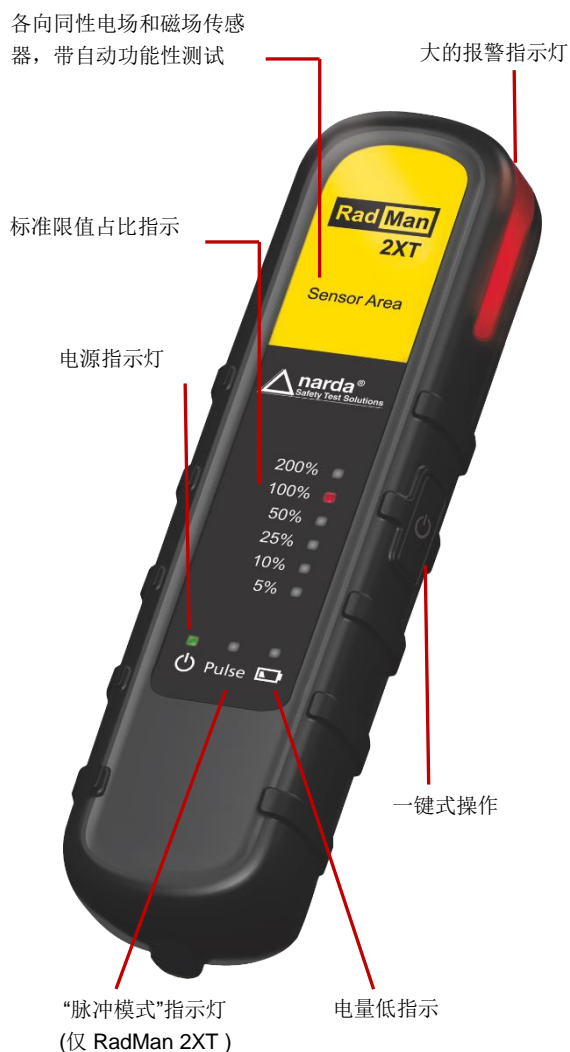
图1 前视图 - 控制和指示灯

实际监测的场强暴露可通过 LED 进行六个级别的显示，从 5% 到 200%。这里的百分比是指功率密度值对应于选定安全标准限值的比值。如果场强暴露超过限值的 50%，仪器会振动同时产生非常响的报警声。在 RadMan 2 的上部也有明亮的报警灯提示，从各个角度很容易就能看到。如果超出 100% 门限，RadMan 2 会进行连续声音报警，从而警告用户尽快离开危险区域。