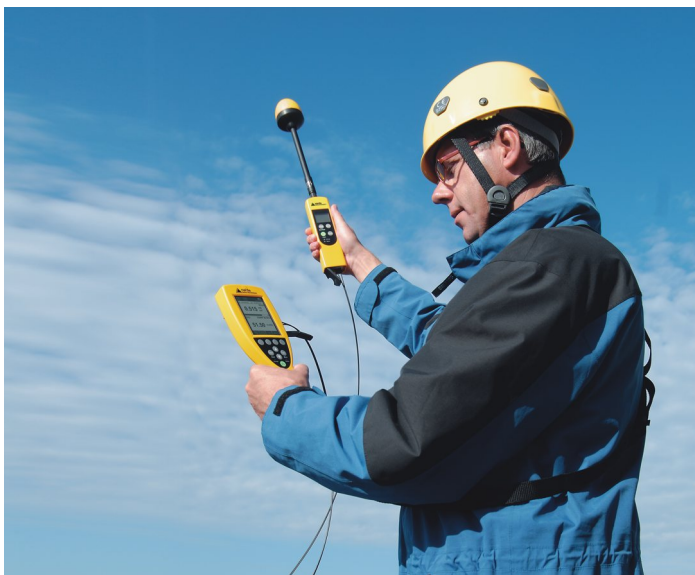
Sondenverlängerung über optisches Kabel. Das NBM-550 dient als Steuergerät und zeigt die Ergebnisse. Das kleine NBM-520 dient als optisches Sondeninterface. Beide Geräte können aber auch völlig unabhängig voneinander mit Messsonde eingesetzt werden.