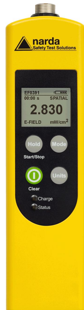
Narda Broadband Field Meter NBM-520