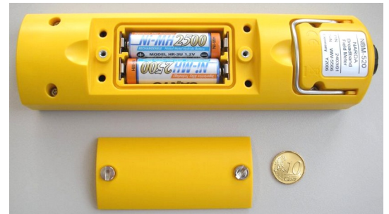
Das Batteriefach lässt sich einfach mit einer Münze öffnen. Das Gerät wird von zwei austauschbaren NiMH-Akkus Typ "AA" versorgt.