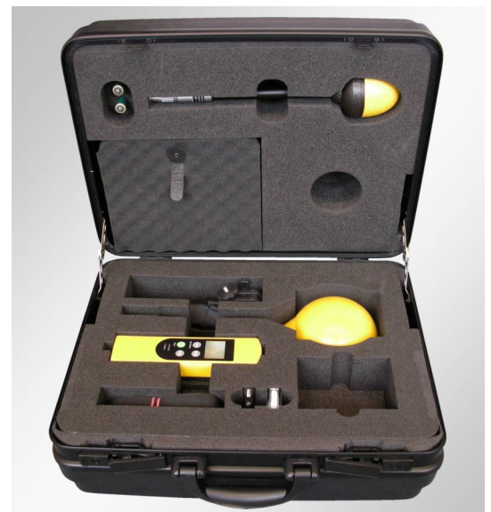
Ein stabiler Transportkoffer ist im Lieferumfang enthalten. Er bietet optimalen Schutz für das Messgerät, für bis zu zwei optionale Sonden sowie für das gesamte Zubehör.